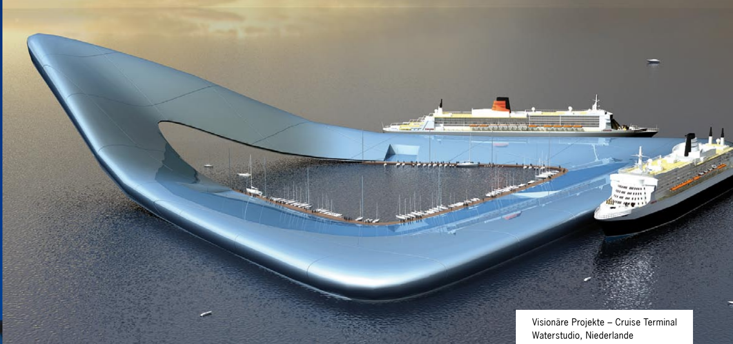
Visionäre Projekte – Cruise Terminal Waterstudio, Niederlande

Die Schnittstellen, die Land von Wasser, Bauwerk von Nässe, Kontrolle von Natürlichkeit trennen.